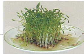
シャンプーから発芽した様子