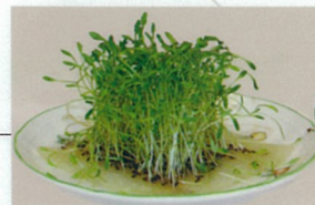
シャンプーから発芽した様子