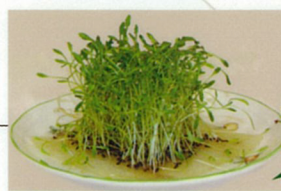
Buds sprouting from shampoo

Buds of plants sprouted from Mofid Shampoo.