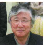
伊豆松崎相場から 日本一美味しい 桑葉茶の誕生

(日本食品分析センターによる分析) ※紹介した効果効能は栄養成分に期待される効果であり、本製品そのものに対する効果ではありません。予めご了承ください。